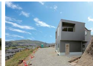
眺望を臨むインナーガレージの メゾネット 1LDK